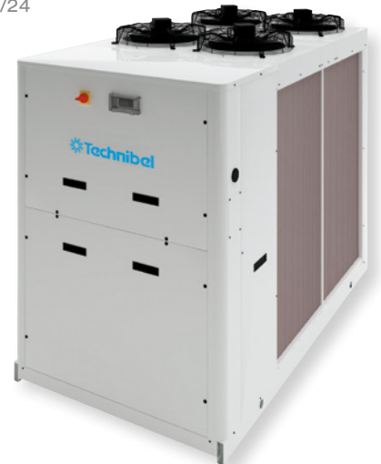
GEF 55 à 76