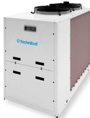
GEF 28 à 40