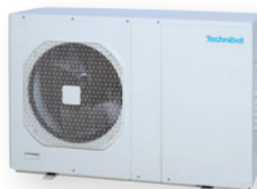
AQUASET 6 et 9