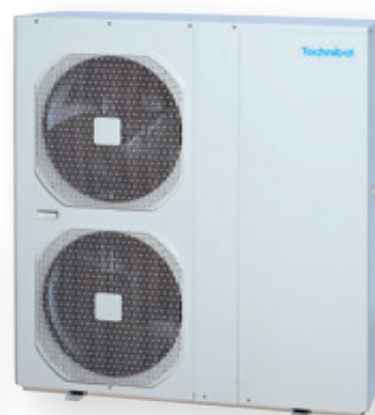
AQUASET 11 et 14