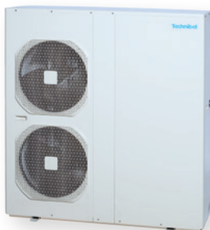
AQUASET 20 et 24